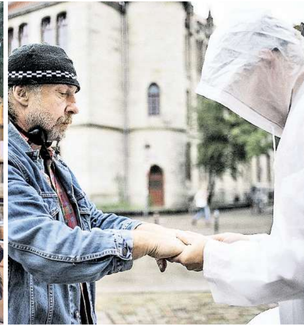
Fluchtgeschichten im Ohr und die Nordstadt vor Augen: Das Theaterprojekt spielt mit sinnlichem Erleben.

das Publikum zudem auf kleine Inszenierungen und Installationen.